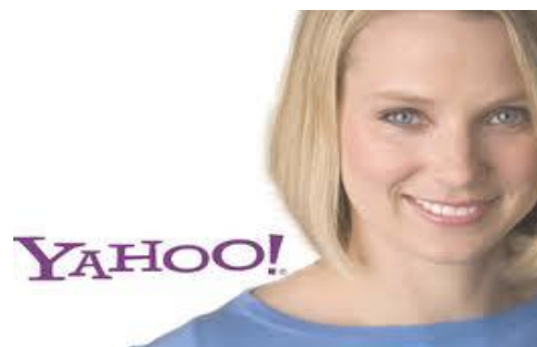
Марисса Майер – президент и исполнительный директор компании.