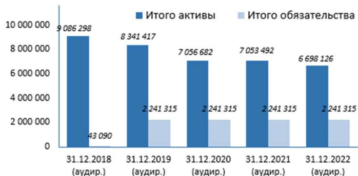
Динамика выделенных активов и обязательств