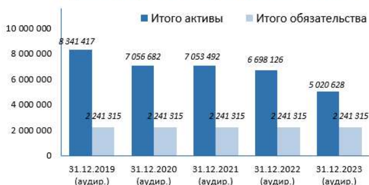
Динамика выделенных активов и обязательств